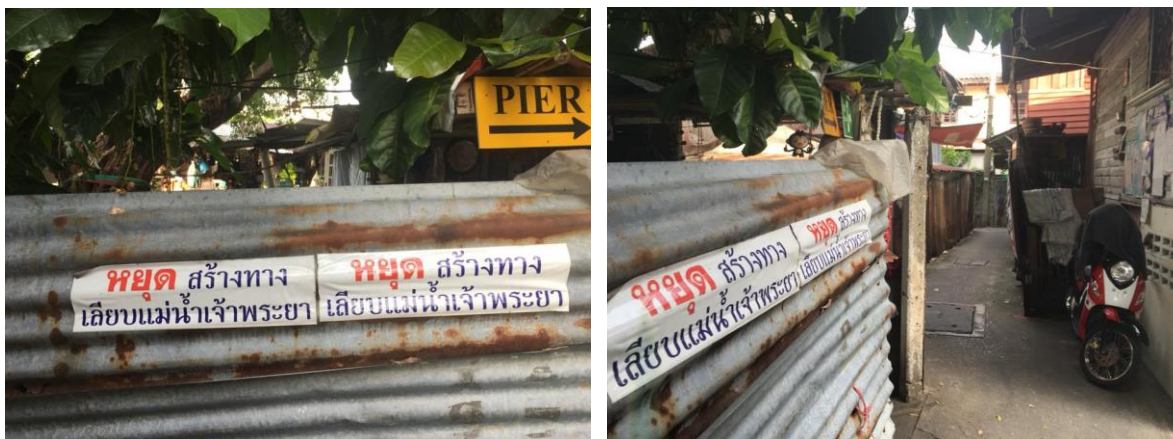
ภาพที่ 4.30 – 4.31 ภาพสติกเกอร์ต่อต้านการสร้างทางเลียบแม่น้ำเจ้าพระยาที่ติดอยู่ภายในชุมชนบ้านปูน

ชุมชนบ้านปูนเป็นชุมชนย่านเก่าแห่งหนึ่งในพื้นที่กรุงเทพมหานคร ซึ่งอยู่ในพื้นที่ของโครงการพัฒนาโครงการใหญ่ของภาครัฐ เห็นได้จากโครงการสร้างสะพานพระราม 8 ตามที่ได้กล่าวมาแล้วในหัวข้อก่อนหน้านี้ ต่อมาเมื่อรัฐบาลของคณะรักษาความสงบเรียบร้อยแห่งชาติ (คสช.) ได้มีมติเกี่ยวกับแผนแม่บทสำหรับโครงการพัฒนาริมฝั่งแม่น้ำเจ้าพระยา โดยมีโครงการสร้างเส้นทางเลียบริมฝั่งแม่น้ำที่ครอบคลุมทั้งในเขตกรุงเทพมหานคร นนทบุรี ปทุมธานี และสมุทรปราการ ชุมชนบ้านปูนก็เป็นพื้นที่ที่อยู่ในโครงการพัฒนาอันเกี่ยวเนื่องกับแผนแม่บทที่ว่านี้เช่นเดียวกัน ในขณะที่ผลดีผลเสียที่จะเกิดขึ้นตามมาจากการสร้างทางเลียบแม่น้ำก็เป็นประเด็นที่หลายฝ่ายให้ความสนใจ