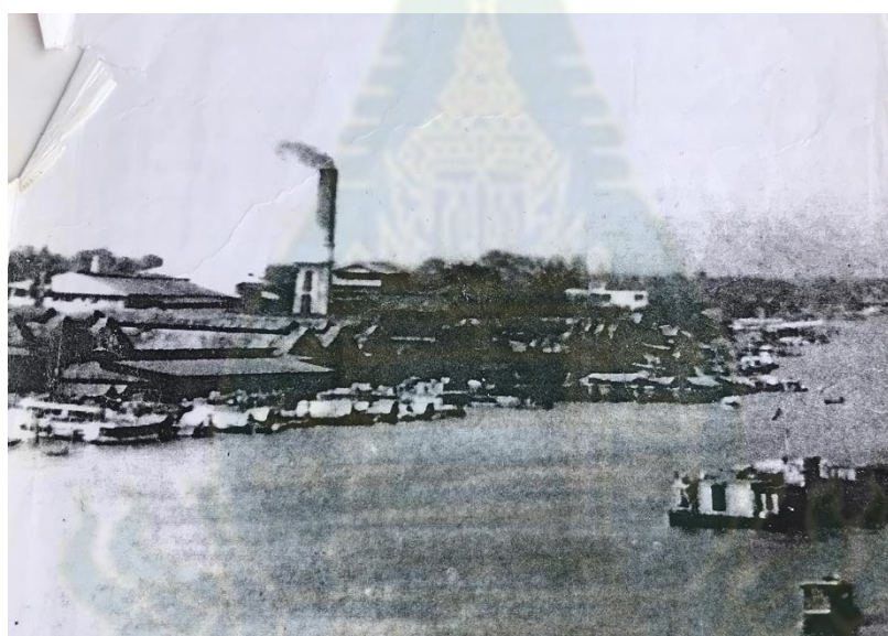
ภาพที่ 4.15 ภาพโรงงานสุราบางยี่ขันในช่วงปี 2512

117) ในสมัยพระบาทสมเด็จพระจุลจอมเกล้าเจ้าอยู่หัว (รัชกาลที่ 5) ได้มีการยกเลิกระบบนายอากร อันเนื่องมาจากปัญหาเกี่ยวกับการจัดเก็บภาษีที่ได้อย่างไม่เต็มเม็ดเต็มหน่วย ในปี 2452 จึงได้มีการตั้งกรมสุราขึ้น เพื่อให้เชื้อต่อการจัดเก็บภาษี กรมสุรานี้ถือว่าเป็นจุดตั้งต้นของกรมสรรพสามิต (ฐาปณี ทินทรชัย และวิไล ตันตินันท์ธนา, 2541: น.8, 10 และ19) ต่อมาก็ได้มีการโอนโรงสุราให้ขึ้นตรงกับกรมสรรพสามิต กระทรวงการคลังในปี 2474 (ฐาปณี ทินทรชัย และวิไล ตันตินันท์ธนา, 2541: น.19) เป็นผลทำให้กลุ่มคนงานในโรงงานสุราเป็นแรงงานที่ขึ้นตรงกับกรมสรรพสามิต บางส่วนเป็นข้าราชการของกรมสรรพสามิต ในช่วงสงครามอินโดจีนจากกรณีพิพาทระหว่างไทยกับฝรั่งเศสเกี่ยวกับดินแดนฝั่งซ้ายของแม่น้ำโขง ซึ่งในขณะนั้นตรงกับสมัยของรัฐบาลจอมพล ป. พิบูลสงคราม ที่ดำเนินนโยบายชาตินิยม โรงงานสุราในควบคุมดูแลของกรมสรรพสามิตแห่งนี้ก็ได้เป็นแหล่งผลิตสุราแม่โขง ซึ่งมีนัยแสดงถึงการเรียกร้องดินแดนคืนในช่วงเวลานั้นด้วย ในปี 2502 รัฐบาลได้เปิดให้เอกชนเข้ามาสัมปทาน เพื่อผลิตและจำหน่ายสุรา บริษัทที่เข้ามาสัมปทานเจ้าแรกคือ บริษัทสุรามหาคุณ ซึ่งในขณะนั้นตรงกับสมัยรัฐบาลจอมพลสฤษดิ์ ธนะรัชต์ (ธนวัฒน์ ทรัพย์ไพบูลย์, 2555: น. 144) ต่อมาโรงงานแห่งนี้ได้ย้ายออกจากพื้นที่ไปในช่วงปี 2538