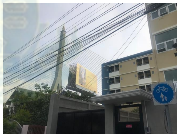
ภาพที่ 4.20 – 4.21 ที่พักอาศัยทั้งที่อยู่ในรูปแบบของคอนโดมิเนียม และอพาร์ทเมนต์ที่ตั้งอยู่ใกล้กับชุมชนบ้านปูน