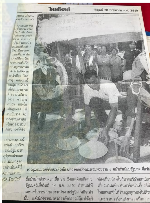
ภาพที่ 4.28 – 4.29 ภาพข่าวจากหนังสือพิมพ์เกี่ยวกับการเคลื่อนไหวของชาวชุมชนบ้านปูนที่เกี่ยวกับปัญหาการเวนคืนที่ดินเพื่อสร้างสะพานพระราม 8