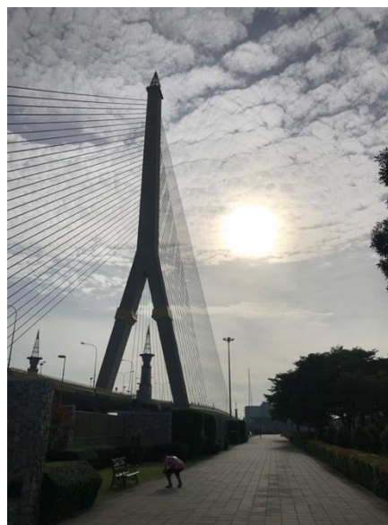
ภาพที่ 4.22 ภาพซ้าย สะพานพระราม 8 จากด้านชุมชนบ้านปูน ภาพที่ 4.23 ภาพขวา สะพานพระราม 8 จากด้านโรงงานสุราบางยี่ขันเดิม

“ดินผืนนี้ ข้าฯ อยู่ ปู่ย่า ไฉนว่า ข้าฯ ผิด ผิดกฎหมาย ใครรัก ใครแน่ ท่านไม่อาย จะขอสู้ จนตาย ให้เป็นธรรม คนบ้านปูน ไกลจะสูญ สิ้นเรือนเหี่ยว คนบ้านปูน กำลังเศร้า ใครจะเห็น คนบ้านปูน จำต้องสู้ เพราะจำเป็น คนบ้านปูน ไม่อยากเห็น ‘ไทยฆ่าไทย’”