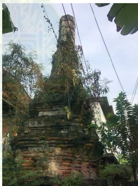
ภาพที่ 4.11 – 4.12 ภาพปรางค์ของวัดสวนสวรรค์