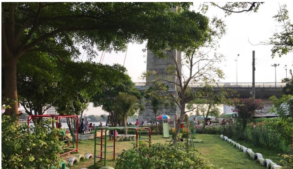
ภาพที่ 4.17 ภาพสถานที่ที่สันนิษฐานว่าเป็นที่ตั้งของโรงฝึก จากคำบอกเล่าของลุงจื่อ ปัจจุบันปรับพื้นที่เป็นสนามเด็กเล่นของศูนย์สร้างโอกาสเด็กพระราม 8

ความคึกคักของชุมชนซึ่งเป็นผลมาจากการตั้งอยู่ใกล้กับแหล่งงาน เป็นผลทำให้เกิดธุรกิจที่เกี่ยวข้องกับการสร้างความสุขให้กับกลุ่มคนงานขึ้น ธุรกิจดังกล่าวคือ โรงฝึก ข้อมูลเกี่ยวกับโรงฝึกนั้นลุงจื่อ (สัมภาษณ์, 2560) ได้เล่าให้ฟังว่า โรงฝึกนี้เป็นธุรกิจของตระกูลธนะภูมิ ในวัยเด็กตนเองยังทันเห็นโรงฝึกในชุมชน สถานที่ตั้งของโรงฝึกนั้นเป็นห้องแถวอยู่บริเวณหน้าบ้านของลุงจื่อ ซึ่งทุกวันนี้พื้นที่บริเวณนี้เป็นที่ดินของทางกรุงเทพมหานครที่ได้มีการเวนคืนไปในช่วงที่มีการสร้างสะพานพระราม 8 ปัจจุบันเป็นที่ตั้งของศูนย์สร้างโอกาสเด็กพระราม 8 ลุงจื่อ (สัมภาษณ์, 2560) เล่าว่า ผู้ที่เข้ามาใช้บริการในโรงฝึกนั้นมีหลายระดับด้วยกัน มีทั้งกลุ่มคนรวยที่มีความคอบั่นฝิ่น ล้างเช็ดกล่องฝิ่นให้ ไปจนถึงแรงงาน ทั้งยังเล่าเสริมด้วยว่าในอดีตนั้นคนในชุมชนที่เลี้ยงนก ก็จะมาเอาเศษฝิ่นมาแช่น้ำ แล้วเอาน้ำนั้นให้นกที่ตนเองเลี้ยงกิน เพราะจะทำให้นกเชื่อง ไม่บินหนีไปไหนไกล ลุงยังให้ข้อมูลเพิ่มเติมอีกว่า แม้แต่ปัจจุคนที่อยู่ในโรงฝึกก็ยังตัวเหลืองเกาะผนังโรงฝึกที่ชุมชนบ้านปูนนี้ได้เลิกไปในสมัยรัฐบาลจอมพลสฤษดิ์ ธนะรัชต์ เนื่องจากช่วงเวลานั้นมีการปราบปรามอย่างรุนแรง