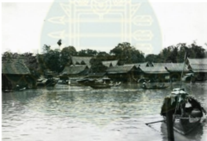
ภาพที่ 4.2 บ้านเรือนริมน้ำในอดีต

นอกจากบันทึกของชาวต่างชาติแล้ว จะเห็นได้ว่าหากย้อนกลับไปพิจารณาหลักฐานวรรณกรรมในสมัยกรุงศรีอยุธยา ก็จะได้เห็นว่ามีการพรรณานำเสนอถึงพื้นที่บริเวณเมืองบางกอกที่เต็มไปด้วยสวนผลไม้เช่นเดียวกัน วรรณกรรมดังกล่าวคือ โคลงกำสรวล ซึ่งถูกจัดอยู่ในวรรณคดีนิราศ เดิมเชื่อว่าศรีปราชญ์เป็นผู้แต่งในขณะที่ต้องอาญาและถูกเนรเทศไปยังเมืองนครศรีธรรมราช หากแต่ในปัจจุบันก็มีข้อถกเถียงกันในหมู่นักวรรณคดีทำให้ยังไม่สามารถสรุปได้ว่าใครเป็นผู้แต่ง อีกทั้งช่วงเวลาในการแต่งนั้นแต่เดิมที่มีการสันนิษฐานกันว่าน่าจะแต่งสมัยสมเด็จพระนารายณ์ หากแต่เมื่อพิจารณารายละเอียดต่าง ๆ ก็อาจทำให้สันนิษฐานได้ว่าเป็นวรรณกรรมที่แต่งขึ้นตั้งแต่ในช่วงต้นของกรุงศรีอยุธยา (ดูรายละเอียดเพิ่มเติมใน วสันต์ รัตนาโกคา, 2557) และถึงแม้ว่าโดยหลักแล้วกวีจะพรรณานำเสนอถึงนางอันเป็นที่รักที่แสดงถึงความโศกเศร้าเมื่อต้องจากนางอันเป็นที่รัก หากแต่รายละเอียดเกี่ยวกับการเดินทางที่ได้สะท้อนผ่านวรรณกรรม ก็ได้ช่วยสะท้อนให้เห็นถึงบริบทต่าง ๆ ของพื้นที่ที่กวีเดินทางผ่านด้วย นอกจากนี้แล้วยังปรากฏข้อมูลในนิราศเมืองเพชรบุรี (เพลงยาวหม่อมอมภิมเสน) ที่สันนิษฐานว่าแต่งขึ้นในสมัยกรุงศรีอยุธยาตอนปลายด้วย (ดูรายละเอียดเพิ่มเติมใน ประภัสสร ชูวิเชียร, 2561; วลัยลักษณ์ ทรงศิริ, 2559: (ออนไลน์))