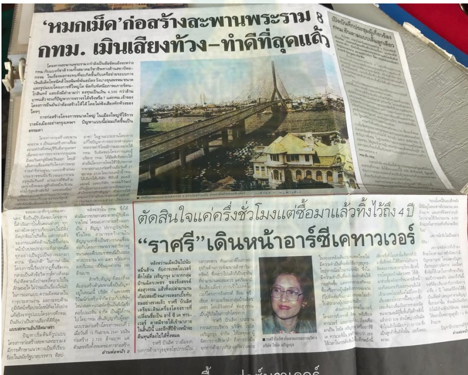
ภาพที่ 4.26 – 4.27 ภาพและเนื้อหาข่าวจากหนังสือพิมพ์ในประเด็นปัญหาที่ เกี่ยวข้องกับการเวนคืนที่ดินเพื่อสร้างสะพานพระราม 8