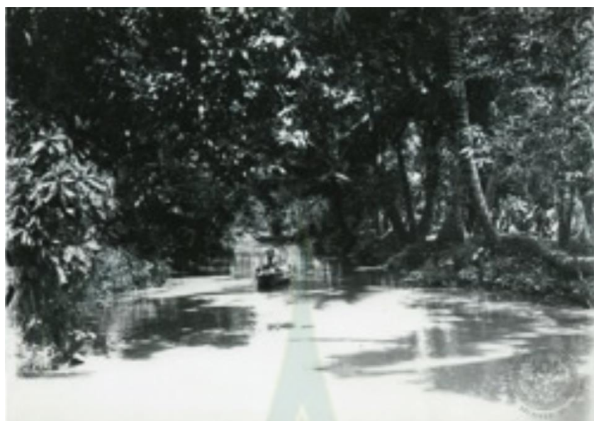
ภาพที่ 4.1 เรือกสวนในอดีต

จากการที่บริเวณนี้เป็นพื้นที่ที่เกิดจากการทับถมของดินตะกอน อีกทั้งยังเป็นพื้นที่ที่ดินมีคุณสมบัติ ลักจืดลักเค็ม (สุตารา สุจฉายา, 2560: น.51) ซึ่งเป็นผลมาจากระบบน้ำกร่อยที่ดันเข้ามาจากทะเลและน้ำจืด (วลัยลักษณ์ ทรงศิริ, 2559: ออนไลน์) เป็นผลทำให้พื้นที่ในบริเวณดังกล่าวนี้เหมาะแก่การปลูกผลไม้ ทั้งยังได้ผลไม้มือรสดีอีกด้วย สภาพการณ์ที่เป็นไปตามสภาพแวดล้อมทางธรรมชาติในลักษณะนี้ นอกจากจะเอื้อประโยชน์ให้กับการเติบโตของต้นไม้แล้ว หากแต่ในขณะเดียวกันชาวสวนก็จะต้องมีการเรียนรู้เพื่อปรับตัวให้เข้ากับสภาพดังกล่าวให้ได้ด้วย โดยจะเห็นได้ว่าการทำเขื่อนป้องกันความเปลี่ยนแปลงของน้ำจากการเกิดน้ำขึ้นน้ำลง (วลัยลักษณ์ ทรงศิริ, 2559: ออนไลน์) การยกร่องสวนนั้นนอกจากจะทำให้สามารถกั้นน้ำเค็ม และควบคุมน้ำจืดได้แล้ว ดินที่ยกร่องขึ้นไปสามารถนำมาใช้ประโยชน์ได้อีก โดยอยู่ในลักษณะของการหมุนเวียน ในแต่ละปีจะมีการขุดลอกท้องร่องเพื่อนำดินเลนจากในท้องร่องขึ้นมาโปะหน้าดิน เพื่อให้ดินยังคงอยู่ในสภาพที่มีความอุดมสมบูรณ์ (จิราภรณ์ เชื้อไทย และคณะ, 2556: น. 96)