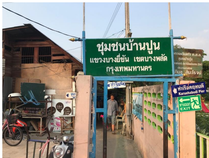
ภาพที่ 4.4 ภาพทางเข้าชุมชนบ้านปูน จากทางด้านแนวกำแพงวังเจ้าอนุวงศ์