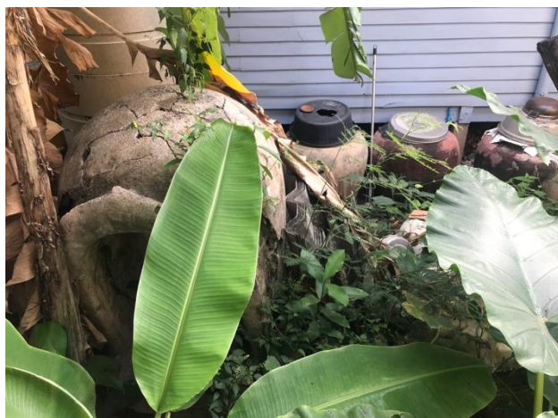
ภาพที่ 4.8 – 4.9 ภาพซุ้มเสมาของวัดสวนสวรรค์