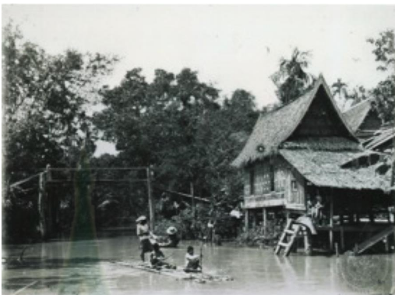
ภาพที่ 4.3 บ้านเรือนริมน้ำในอดีต

ในด้านที่เกี่ยวข้องกับความหลากหลายของกลุ่มผู้คนไปจนถึงลักษณะของการตั้งบ้านเรือน ในส่วนที่เกี่ยวข้องกับ ความหลากหลายของกลุ่มผู้คน นั้น สิ่งที่ได้เห็นได้อย่างชัดเจนในปัจจุบันคือ การดำรงอยู่ของชุมชนย่านเก่า ที่สามารถบ่งบอกได้ถึงอัตลักษณ์ของผู้อยู่ ซึ่งมีจากทั้งการประกอบอาชีพ ความเป็นชาติพันธุ์ ไปจนถึงในเรื่องศาสนา ยกตัวอย่างเช่น ชุมชนบ้านขมิ้นแต่เดิมเป็นชุมชนที่มีการผลิตผลขมิ้นเพื่อส่งขาย ชุมชนบ้านแขกเป็นถิ่นที่อยู่ของชาวมลายูที่มาจากหัวเมืองทางภาคใต้ อันมีปัจจัยที่เกี่ยวข้องกับการเมืองเป็นสำคัญ ชุมชนบ้านบุเป็นชุมชนที่มีชื่อเสียงในการทำชันลงหิน ชุมชนกะดีจีนและชุมชนคลองสานเป็นพื้นที่ที่มีทั้งกลุ่มชาวจีน ชาวมุสลิม และชาวตะวันตกต่างเข้ามาตั้งบ้านเรือนกันเป็นจำนวนมาก โดยเฉพาะในช่วงที่ศูนย์กลางอำนาจทางการเมืองที่กรุงศรีอยุธยาหมดอำนาจลง เป็นผลทำให้เป็นชุมชนที่มีความหลากหลายทางวัฒนธรรม ชุมชนบางไผ่ไก่อ๊ก็ เป็นชุมชนชาวลาวที่ถูกกวาดต้อนมาจากเมืองเวียงจันทน์จากการทำศึกสงคราม ได้เข้ามาตั้งถิ่นฐานและอยู่รวมกันเป็นหมู่บ้านลาว คนกลุ่มนี้มีความสามารถในการทำขลุ่ย ทำแคน