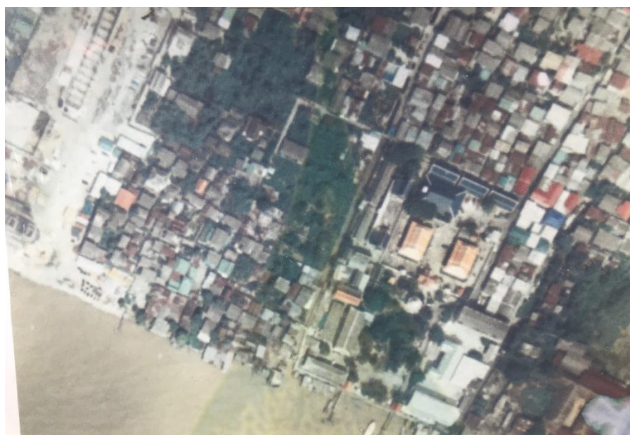
ภาพที่ 4.19 ภาพถ่ายทางอากาศชุมชนบ้านปูน ที่แสดงให้เห็นอย่างชัดเจนว่าชุมชนแห่งนี้ ผู้คนเข้ามาตั้งบ้านเรือนอยู่อย่างแออัด

ตระกูลธนระภูมิ (พระญาติบ้านปูน) ที่มีสายสัมพันธ์กับในรั้วในวัง ทั้งยังมีความเชื่อมโยงกับตระกูลบริพัตร ซึ่งเป็นเจ้าของที่ดินในชุมชนแห่งนี้ในปัจจุบันด้วย นอกจากนี้ตระกูลที่กล่าวมาแล้วก็ยังมีอีกตระกูลหนึ่งคือ ตระกูลรามสมภพ สาเหตุที่ผู้วิจัยให้ความสำคัญกับ 3 ตระกูลนี้เป็นผลมาจากข้อมูลสัมภาษณ์จากคนในชุมชนโดยเฉพาะกลุ่มคนที่เข้ามาอยู่ในชุมชนในรอบหลังจากที่กลุ่มตระกูลเหล่านี้ได้ย้ายออกไป เมื่อผู้วิจัยถามถึงเจ้าของที่ดินที่คนเหล่านั้นซื้อต่อมา หรือเช่าต่อ ก็จะตอบไปในทางเดียวกันว่าที่ดินส่วนใหญ่ในชุมชนยังคงเป็นของตระกูลเหล่านี้