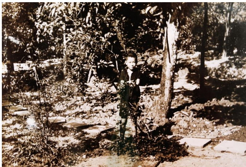
ภาพที่ 4.18 ภาพของลุงจือในวัยเด็ก ด้านหลังเป็นสวนผลไม้ในชุมชนบ้านปูน

, 2560) ได้เล่าให้ฟังว่า “ส่วนตัวแล้วชอบเงาะกะเทย เนื่องจากว่าไม่มีเมล็ด ทำให้กินง่าย เงาะมีทั้งลูกแบน และลูกกลม ลูกแบนจะอร่อยกว่าเพราะเนื้อกรอบกว่าลูกกลม ส่วนลูกกลมเนื้อจะล่อนไม่มาก”