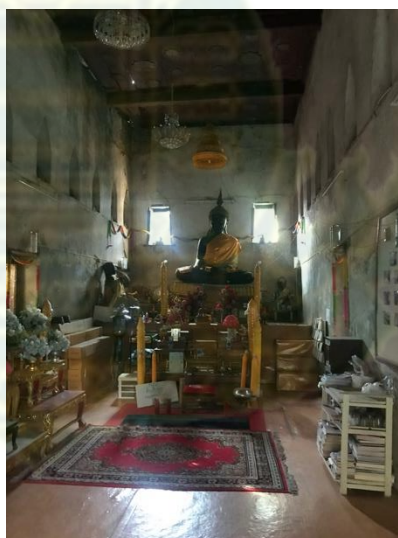
ภาพที่ 4.6 – 4.7 สภาพโบสถ์ภายนอกและภายในของ วัดสวนสุวรรณค์ในปัจจุบัน