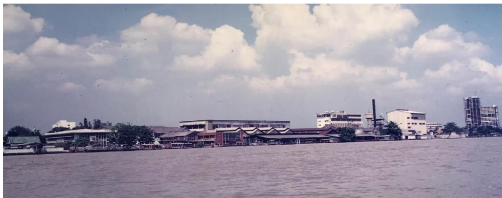
ภาพที่ 4.16 ภาพโรงงานสุราบางยี่ขันซึ่งถ่ายจากอีกฟากฝั่งหนึ่งของแม่น้ำเจ้าพระยา (ในช่วงที่ยังไม่สร้างสะพานพระราม 8)

การตั้งโรงงานในพื้นที่นี้อย่างถาวรได้กลายเป็นปัจจัยสำคัญที่ทำให้มีกลุ่มแรงงานเข้ามาตั้งบ้านเรือนในพื้นที่นี้ด้วย ส่วนใหญ่แล้วจะเป็นกลุ่มแรงงานชาวจีนที่เข้ามาเป็นจับกัง ความคึกคักของชุมชนย่านนี้ในอดีตส่วนหนึ่งเป็นผลเป็นผลมาจากการเป็นที่ตั้งของโรงงาน จากข้อมูลสัมภาษณ์คนแก่คนแก่ในชุมชนทำให้ทราบว่า จุดเริ่มต้นที่ครอบครัวย้ายมาอยู่ในชุมชนบ้านปูนแห่งนี้เป็นเพราะว่าพ่อแม่มาทำงานในโรงงานสุรา