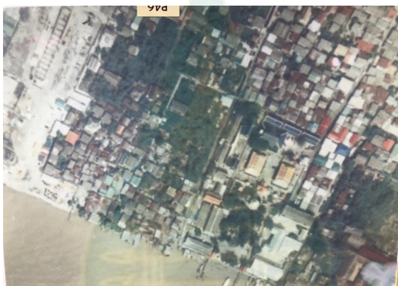
ภาพที่ 4.5 ถ่ายทางอากาศชุมชนบ้านปูนในช่วงที่กำลังก่อสร้างสะพานพระราม 8

หนึ่งที่สัมพันธ์กับวิถีของกลุ่มแรงงานในโรงงานสุรา และผู้คนกลุ่มอื่น ๆ ด้วย และหากจะกล่าวถึงกิจกรรมอันเป็นที่มาของอัตลักษณ์ของชุมชนบ้านปูนแห่งนี้ ก็คงหนีไปพ้นการทำปูน อันเป็นที่มาของชื่อชุมชนนั่นเอง ขณะเดียวกันการทำปูนก็เชื่อว่าจะเป็นกิจกรรมหลักกิจกรรมเดียวของผู้คนที่นี่ เพราะจะเห็นได้ว่าในหัวข้อก่อนหน้าผู้วิจัยได้นำเสนอข้อมูลเกี่ยวกับความอุดมสมบูรณ์ของพื้นที่บริเวณนี้ ซึ่งอยู่ในเขตของสวนในบางกอก และอยู่ในเขตสวนบางบน กิจกรรมที่สัมพันธ์กับการใช้พื้นที่ที่เกิดขึ้นในอดีตอีกอย่างหนึ่งคือการทำสวนผลไม้ นอกจากนี้แล้วยังมีอีกกิจกรรมหนึ่งซึ่งเป็นสินค้าส่งออกสำคัญอีกอย่างหนึ่งของชุมชนบ้านปูน นอกจากปูนแล้วก็คือ เต้าอั้งโล่ ก่อนที่จะกล่าวถึงข้อมูลตามที่ได้กล่าวมาในข้างต้นนี้ ก่อนอื่นผู้วิจัยจะให้ข้อมูลเกี่ยวกับที่ตั้ง รวมถึงอาณาบริเวณของชุมชน รวมถึงข้อมูลโดยสังเขปเกี่ยวกับผู้คนที่ตั้งแต่วัยแรกๆ ที่เข้ามาตั้งบ้านเรือน และผู้คนที่หลั่งไหลเข้ามาในชุมชนแห่งนี้ในแต่ละช่วงเวลาเสียก่อนที่จะนำไปสู่ข้อมูลเกี่ยวกับพื้นที่และผู้คนที่ตามประเด็นที่ได้เกริ่นมาในตอนต้น